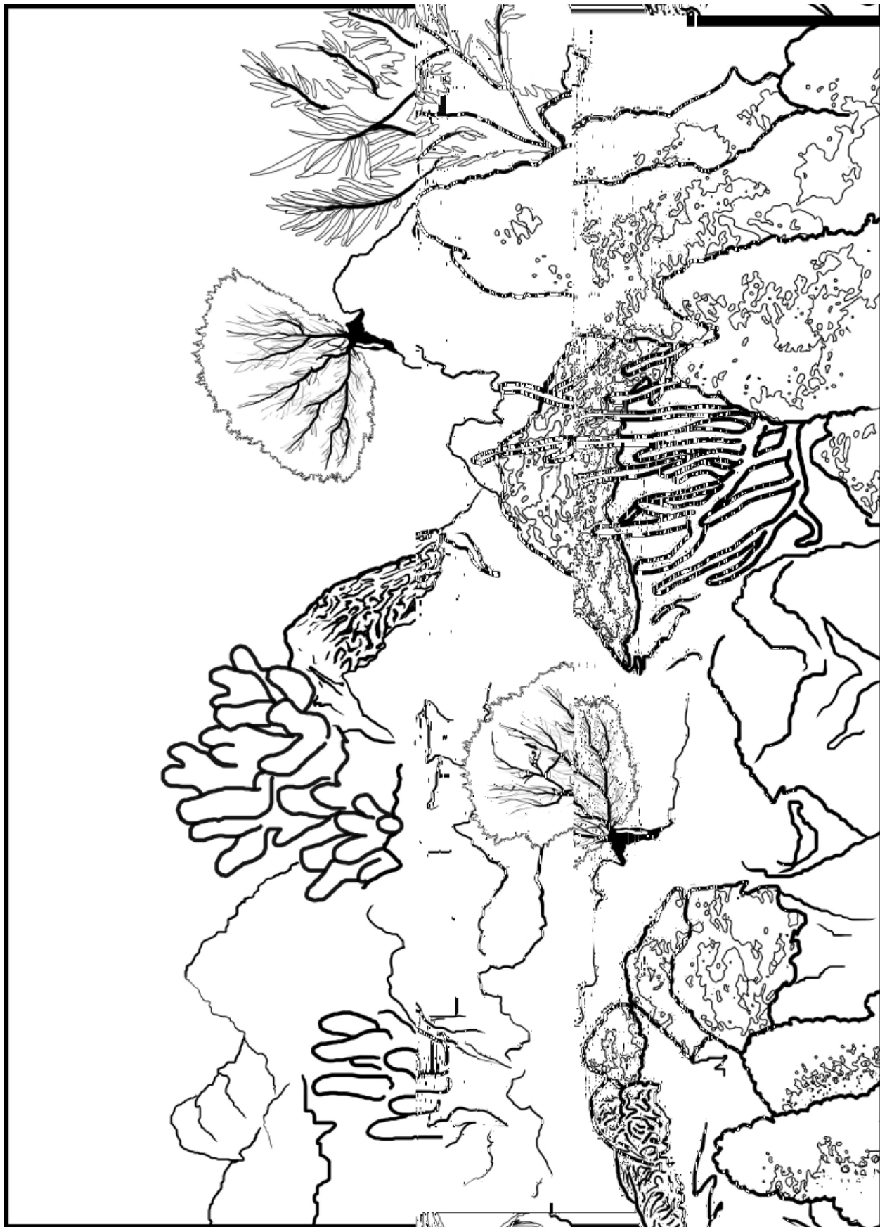
Ilustración por Jorge Montes Goñi