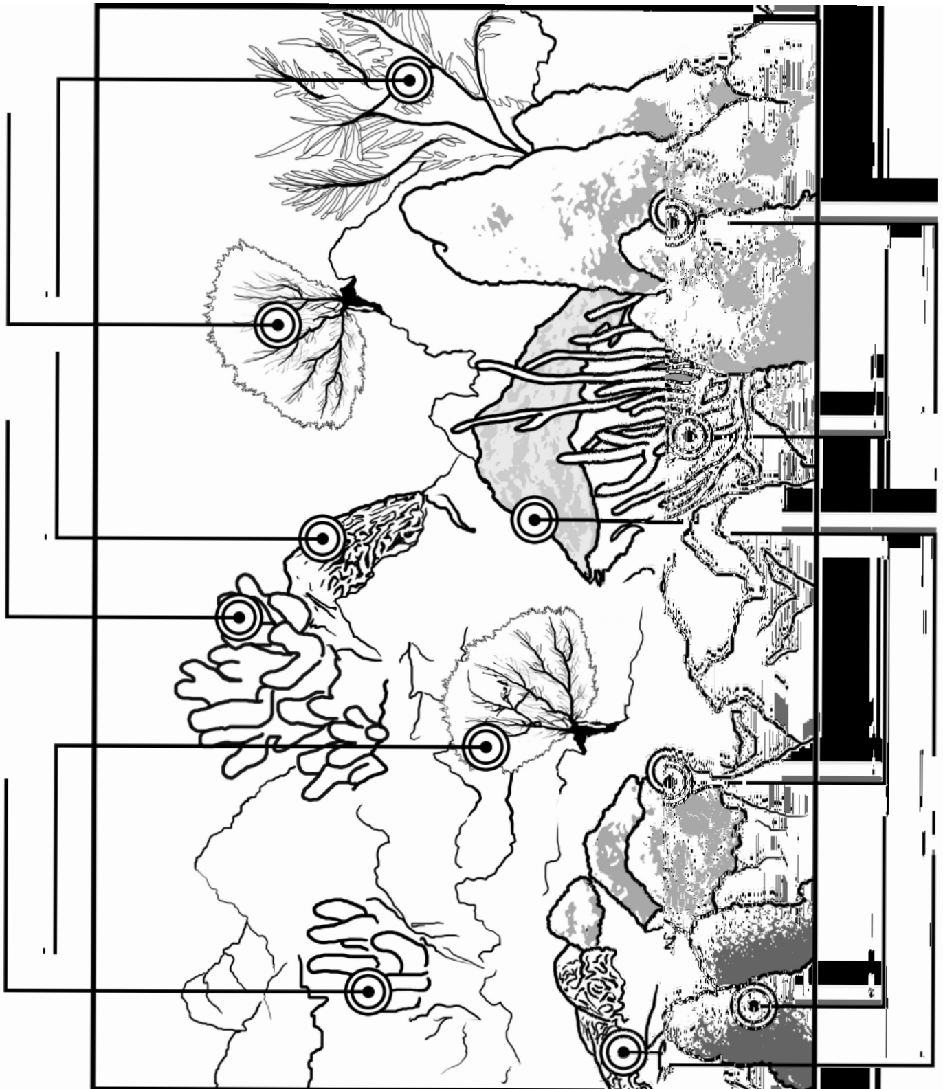
Ilustración por Jorge Montes Goñi